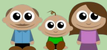
Les représentants légaux

Être associé dans le suivi de leur enfant